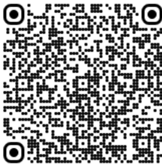
QR code réservation repas